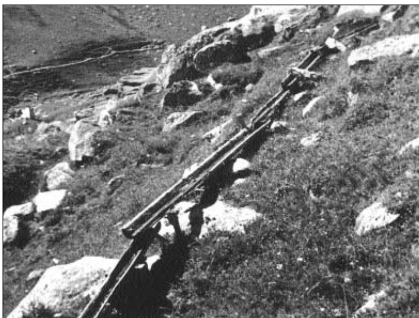
Chanals da lain mo ina sur tschella, gnanc liadas tranter pèr (Valtgeva, Tujetsch).

la metoda veglia e da quella «moderna» vegnan a pled (Fögl Ladin, 18.7.1947). Nel 1970 vegniva sauà mo pli en Engiadina Bassa (en Val Müstair ed a Zerne), en il Partenz ed en il Puschlav. Quest' engiaviner vegn da la Surselva: «Enzatgei pli bia ch'in taglia giu, pli liung ch'ei vegn (il dutg da schuar)».