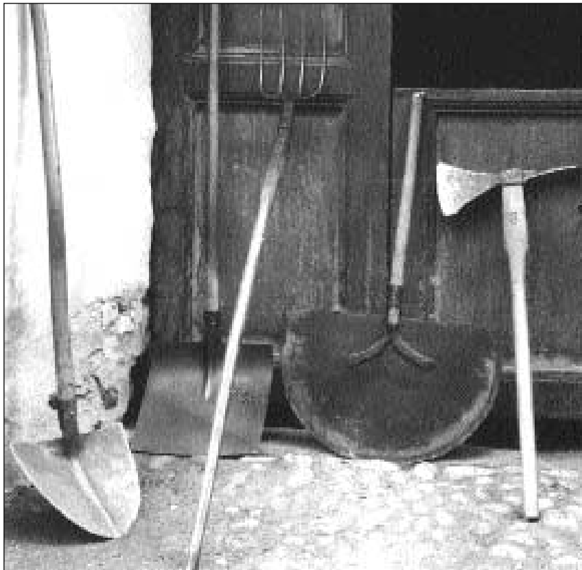
(Da sanestra) badigl – pala da naiv – furtga da grascha – pala da sauar, che vegn chatschad'en per travers dal dutg, per tegnair si l'aua – zappa d'uals u zappa da far dutgs; La part ch'è sco ina sigir serva per tagliar il tschispet (Zerne 1921).