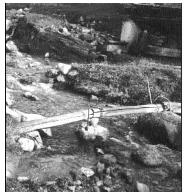
Chanal da lain cuverta: il «viertgel» è lià si.