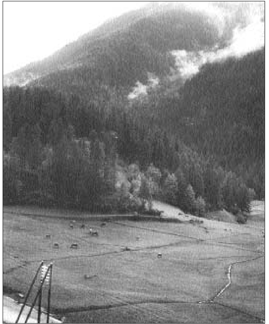
Prada culs uals da sauar ed il muvel a bual (sut la staziun da Guarda).

Sauar era derasà en tut il Grischun, in dals documents ils pli vegls è en l'archiv da Tartar (Muntogna) ed è dal 1549. En in protocol da Trun dal 1703 èsi menziunà co decider, nua ch'i fiss da chavar l'ual da sauar: «Nua ch'ei podes vegnir schuau deigi da mintgin vegnir dau dutg in a lauter sil mender donn». Er la larghezza dals uals da sauar era prescritta, sco che nus pudain leger en in statut da Vaz dal 18avel tschientaner: «Igl doitgs ner fossadas della ava à tgie-sas deigien beitg esser pli lādās tgè d'eing pèh lung».